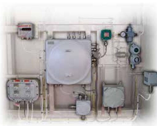
MicroGC ATEX SRA Instruments

Analyseur de terrain, sa construction robuste et compacte s'adapte à l'installation dans le domaine industriel : en extérieur, en zone dangereuse (couvercle extérieur antidéflagrant).